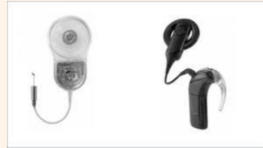
PRÓTESIS AUDITIVAS - IMPLANTES

Prótesis Auditivas, Prótesis oculares, Sillas de ruedas deportivas.