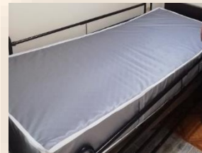
COLCHÓN ANTI ESCARAS

Fuente: Lineamiento para el Otorgamiento de Dispositivos de Asistencia Personal - Ayudas Técnicas No incluidas en el Plan de Beneficios, a través de los Fondos de Desarrollo Local del Distrito Capital - 2021 Sexta Edición” de la SDS.