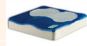
COJÍN EN GEL