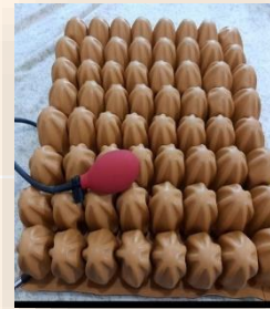
COJÍN EN AIRE