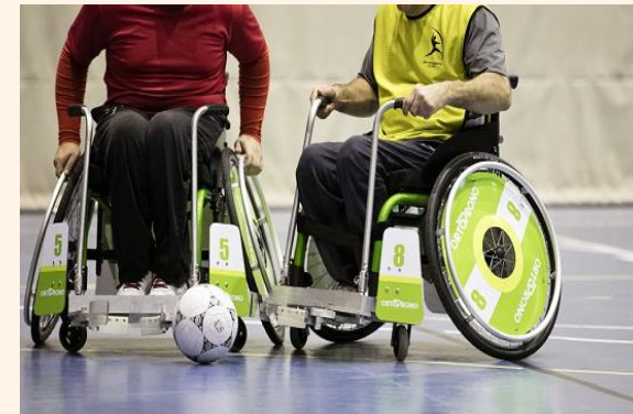
SILLA DE RUEDAS DEPORTIVAS