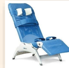
SILLA BAÑO ESPECIAL PLAYERA