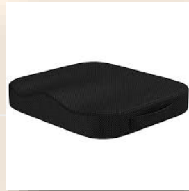
COJÍN EN ESPUMA

Colchones y cojines anti escaras en aire, en espuma y en gel