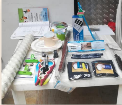
Dispositivos vestirse y desvestirse, ganchos, abotonadores